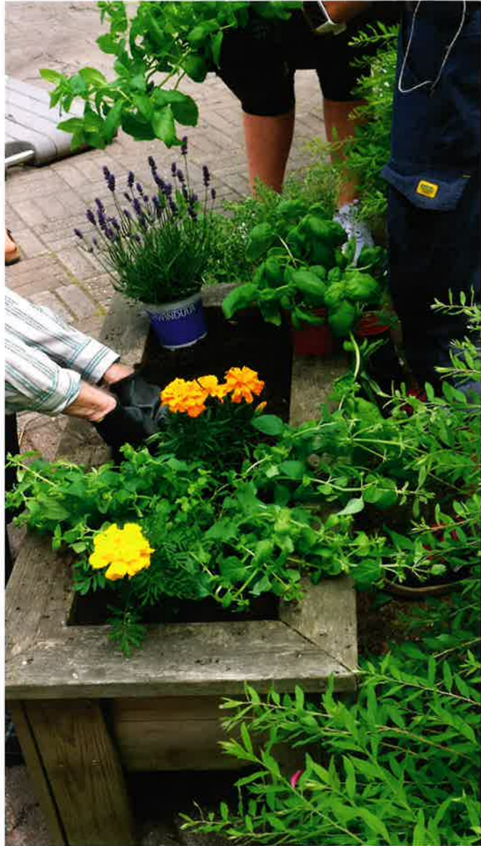
Kausikasvien ja yrttien istuttamista osallistavan toiminnan päivässä.